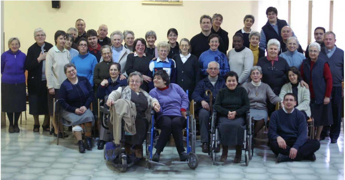
Assemblea Generale 2008 con i nuovi superiori e i nuovi eletti.